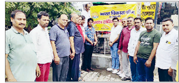
तरावड़ी। वाटर कूलर का शुभारंभ करते परिषद के सदस्य।