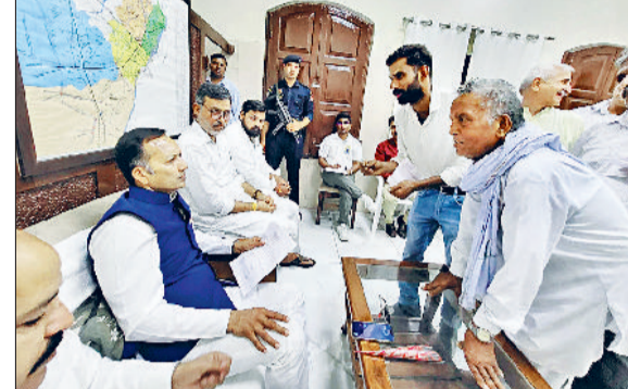
यमुनानगर। रादौर विश्रामगृह में जन समस्याएं सुनते हुए सांसद नवीन जिंदल।

कुरुक्षेत्र के सांसद नवीन जिंदल ने कहा कि यमुना नदी में डाले जा रहे गंदे व दूषित पानी से दुनिया की हरियाणा से होकर दिल्ली में जाता है यमुना नदी का पानी उन्हीं उक्त शब्द रादौर के विश्रामगृह में कार्यकर्ताओं और आमजन की समस्याएं सुनते हुए कहे। उन्होंने संबंधित अधिकारियों को यमुना नदी में डाले जा रहे सीवरेज, फैक्ट्रियों व गंदे पानी को रोकने की दिशा में योजना तैयार करने के