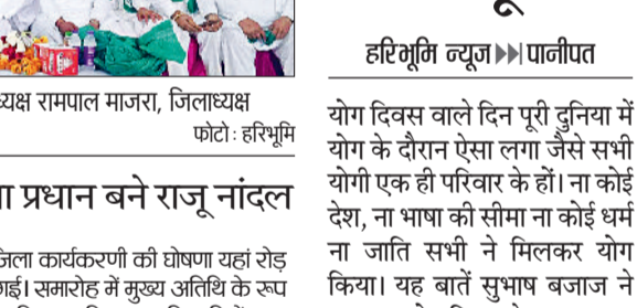
पानीपत। पार्क में योग करते योग साधक।