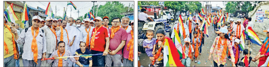
गुलाना। शोभायात्रा के जरिए जैन मुनि का अभिनंदन करते श्रद्धालु।